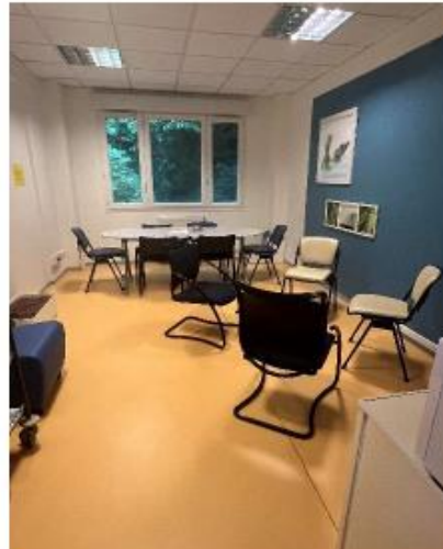
Salle de pause