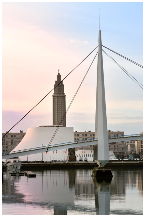
Le bassin du Roi, Au centre ville du Havre

Le Groupe Hospitalier du Havre reçoit chaque semestre une centaine d'internes, pour l'ensemble des disciplines qui y sont représentées.