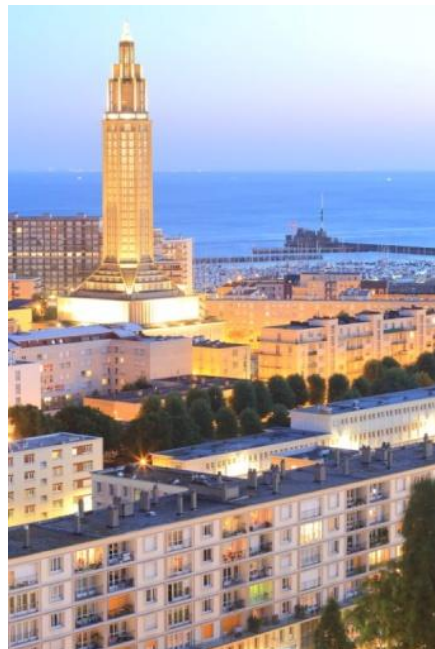
Eglise Saint Joseph