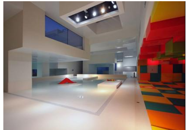
Bains des docks